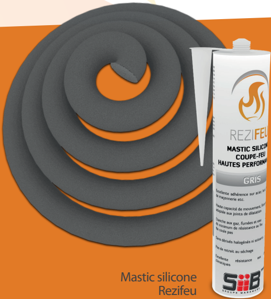
Mastic silicone Rezifeu